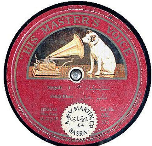
AX.375 سبگه ۱ سلیم خان