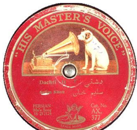
AX.377 دشتی ۲ سلیم خان